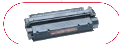
Cartouche intégrée et recyclable