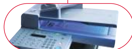
Vitre d'exposition A4

Le FAX-L400 peut être raccordé à un PC via son interface USB. Il fonctionne alors comme une imprimante laser monoposte d'une qualité irréprochable pour vos documents textes et graphiques.